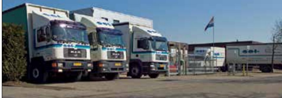
4 't Patternaat